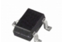
ADM1815-R23AKS-RL7 Analog Devices Inc. IC MONITOR RESET 2.31V SC-70-3