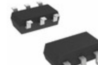
DMC2700UDMQ-7 Diodes Incorporated MOSFET BVDSS: 8V24V SOT26 T&R 3