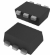
DMC2990UDJ-7 Diodes Incorporated MOSFET N/P-CH 20V SOT963