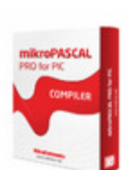
MIKROE-358 MikroElektronika COMPILER MIKROPASCAL PRO PIC