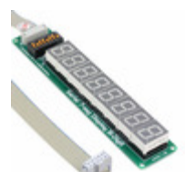
MIKROE-392 MikroElektronika BOARD DISPL SER 7SEG 8DIGIT