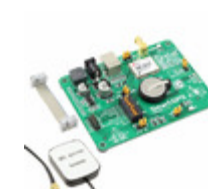
MIKROE-362 MikroElektronika BOARD SMART GPS WITH ANTENNA