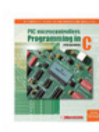
MIKROE-410 MikroElektronika BOOK PIC MCU PROGRAMMING IN C