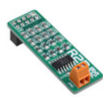
MIKROE-391 MikroElektronika BOARD R/2R LADDER DAC CONV