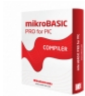
MIKROE-356 MikroElektronika COMPILER MIKROBASIC PRO PIC