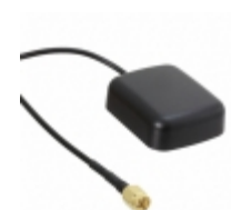
MIKROE-363 MikroElektronika ANTENNA GPS 2M CABLE ACTIVE