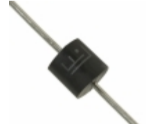
5KP24C Littelfuse Inc. TVS DIODE 24VWM 40.85VC AXIAL