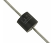
5KP24CA-B Littelfuse Inc. TVS DIODE 24VWM 38.9VC AXIAL