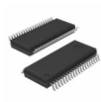
BD34700FV-E2 Rohm Semiconductor IC SOUND PROCESSOR 4CH 40SSOP