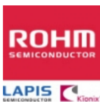
BD34701KS2 Rohm Semiconductor IC SOUND PROCESSOR 7.1CH 52SQFP