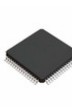
BD34705KS2 LAPIS Semiconductor 7.1CH SOUND PROCESSOR WITH BUILT