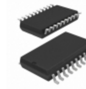
SY10EL38ZC-TR Microchip Technology IC CLK GEN /2 /4/6 5/3.3V 20SOIC