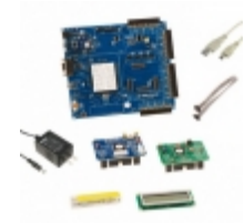
CY8CKIT-001 Cypress Semiconductor KIT DEV FOR PSOC3/5