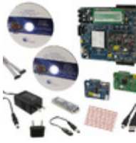
CY8CKIT-001C Cypress Semiconductor KIT DEV FOR PSOC3/5