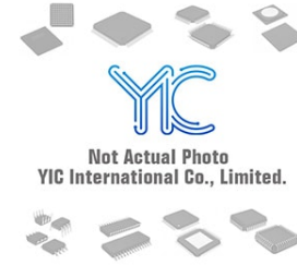
LTC2378CMS-20 LT LTC2378CMS-20 LT