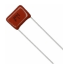
ECQ-P1H393GZ Panasonic Electronic Components CAP FILM 0.039UF 2% 50VDC RADIAL