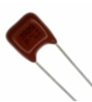
ECQ-P1H392GZ Panasonic Electronic Components CAP FILM 3900PF 2% 50VDC RADIAL