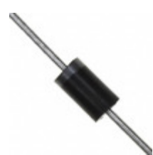
BY228GP-E3/54 Electro-Films (EFI) / Vishay DIODE GEN PURP 1.5KV 2.5A DO201