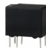
G5V-1-2-DC3 Omron Electronics Inc-EMC Div RELAY GENERAL PURPOSE SPDT 1A 3V