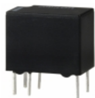
G5V-1-2 DC6 Omron Electronics Inc-EMC Div RELAY GENERAL PURPOSE SPDT 1A 6V