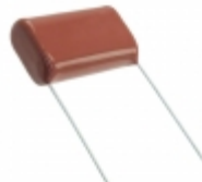
ECQ-E6105JF Panasonic Electronic Components CAP FILM 1UF 5% 630VDC RADIAL