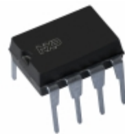
SA5232N/01,112 NXP USA Inc. IC OPAMP GP 2.5MHZ RRO 8DIP