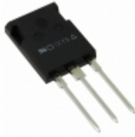
DSEP30-12CR IXYS DIODE GEN 1.2KV 30A ISOPLUS247