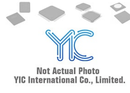
MAX3084ECSA MAXIM MAX3084ECSA MAXIM