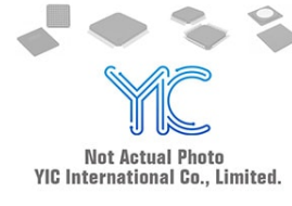
MAX3084CPA MAX MAX3084CPA MAX