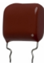
ECQ-P1H204FZW Panasonic Electronic Components CAP FILM 0.2UF 1% 50VDC RADIAL