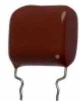
ECQ-P1H184GZW Panasonic Electronic Components CAP FILM 0.18UF 2% 50VDC RADIAL