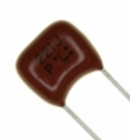
ECQ-P1H221JZ Panasonic Electronic Components CAP FILM 220PF 5% 50VDC RADIAL