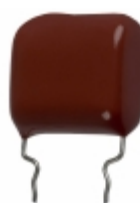
ECQ-P1H184FZW Panasonic Electronic Components CAP FILM 0.18UF 1% 50VDC RADIAL