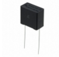
ECQ-UAAF334M Panasonic Electronic Components CAP FILM 0.33UF 20% 275VAC RAD