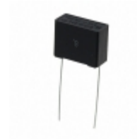
ECQ-UAAF224M Panasonic Electronic Components CAP FILM 0.22UF 20% 275VAC RAD