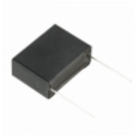
ECQ-UAAF155K Panasonic Electronic Components CAP FILM 1.5UF 10% 275VAC RADIAL