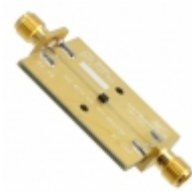
CLA4603-085-EVB Skyworks Solutions Inc. EVAL BOARD FOR CLA4603