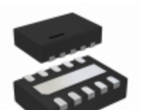
LTC2919CDDDB-2.5#TRMPBF Linear Technology IC MONITOR PREC 2.5V 10-DFN