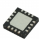
M41T83ZQA6F STMicroelectronics IC RTC CLK/CALENDAR I2C 16-QFN