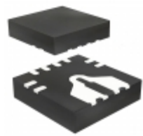
ACS711KEXLT-31AB-T Allegro MicroSystems, LLC SENSOR CURRENT HALL 31A AC/DC