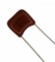
ECQ-B1222JF Panasonic Electronic Components CAP FILM 2200PF 5% 100VDC RADIAL