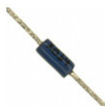
DB3TG STMicroelectronics DIAC 30-34V 2A DO35