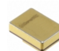
1N8035-GA GeneSiC Semiconductor DIODE SCHOTTKY 650V 14.6A TO276