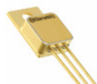
1N8032-GA GeneSiC Semiconductor DIODE SCHOTTKY 650V 2.5A TO257