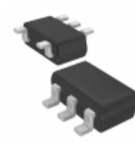
AD8001ARTZ-R2 ADI (Analog Devices, Inc.) IC OPAMP CF LP LDIST SOT23-5