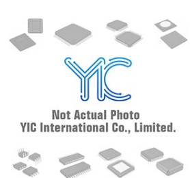
TC211 CORERIV CORERIV QFN