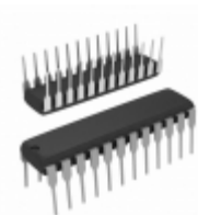
AT28C16E-20PC Microchip Technology IC EEPROM 16KBIT 200NS 24DIP