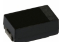
EEF-SD0D271R Panasonic Electronic Components CAP ALUM POLY 270UF 20% 2V SMD