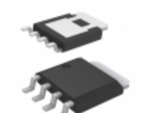
BUK9Y12-40E,115 Nexperia USA Inc. MOSFET N-CH 40V LPAK