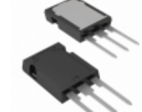
STY60NM50 STMicroelectronics MOSFET N-CH 500V 60A MAX247