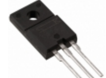
FKV575 Sanken MOSFET N-CH 50V 75A TO-220F