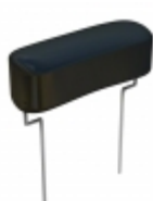
DPFF12D27J-F Cornell Dubilier Electronics (CDE) CAP FILM 2700PF 5% 1.2KVDC RAD