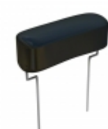
DPFF12D33J-F Cornell Dubilier Electronics (CDE) CAP FILM 3300PF 5% 1.2KVDC RAD