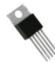
MCP1827-ADJE/AT Microchip Technology IC REG LDO ADJ 1.5A TO220-5