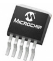
MCP1827-3302E/ET Microchip Technology IC REG LDO 3.3V 1.5A DDPACK