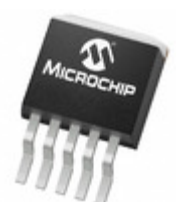
MCP1827-5002E/ET Microchip Technology IC REG LDO 5V 1.5A DDPACK