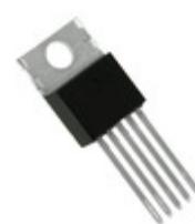
MCP1827-5002E/AT Microchip Technology IC REG LDO 5V 1.5A TO220-5