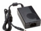
TE40A2403Q01 Ault / SL Power AC/DC DESKTOP ADAPTER 24V 40W