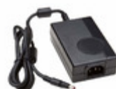
TE40A2403N01 Ault / SL Power AC/DC DESKTOP ADAPTER 24V 40W