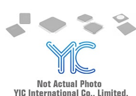
PCA9671D NXP PCA9671D NXP