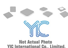
PCA9671BQ NXP PCA9671BQ NXP