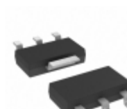
MCP1826S-3002E/DB Microchip Technology IC REG LDO 3V 1A SOT223-3