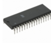
AT27C010L-70PC Microchip Technology IC OTP 1MBIT 70NS 32DIP