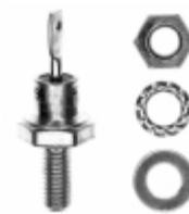
VS-1N3893 Electro-Films (EFI) / Vishay DIODE GEN PURP 400V 12A DO203AA