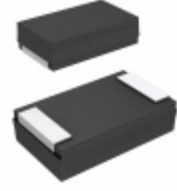
25TQC22MYFT Panasonic Electronic Components CAP TANT POLY 22UF 25V 2917