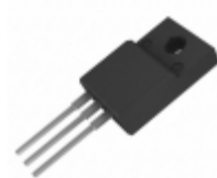
BUT11FTU Fairchild/ON Semiconductor TRANS NPN 400V 5A TO-220F