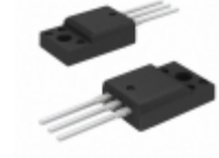
BUT11AFTU AMI Semiconductor / ON Semiconductor TRANS NPN 450V 5A TO-220F