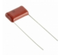
ECQ-E6563RJF Panasonic Electronic Components CAP FILM 0.056UF 5% 630VDC RAD