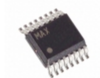
MAX7490EEE+ Maxim Integrated IC FILTER SW CAP DUAL 16-QSOP