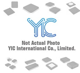
MAX748ACWE MAX MAX748ACWE MAX