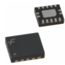
74LCX14BQX Fairchild/ON Semiconductor IC INVERTER HEX SCHMITT 14DQFN