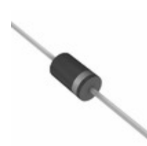
1.5KE22CA A0G TSC (Taiwan Semiconductor) TVS DIODE 18.8V 30.6V DO201