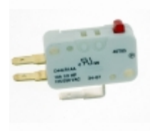
D44L-R1AA ZF Electronics SWITCH SNAP ACTION SPDT 10A 125V