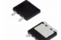
SE20DG-M3/I Electro-Films (EFI) / Vishay DIODE GEN PURP 400V 3.9A TO263AC