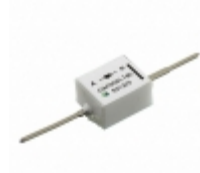
GAP05SLT80-220 GeneSiC Semiconductor DIODE SCHOTTKY 8KV 50MA AXIAL