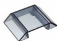
GAP9 Carlo Gavazzi FRONT SAFETY COVER CC9-150