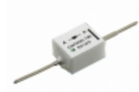
GAP05SLT80-220 GeneSiC Semiconductor DIODE SCHOTTKY 8KV 50MA AXIAL