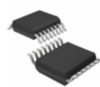
HCPL-902J Broadcom Limited DGTL ISO 2.5KV 4CH GEN PURP 16SO