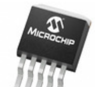
MCP1825-ADJE/ET Microchip Technology IC REG LDO ADJ 0.5A DDPACK