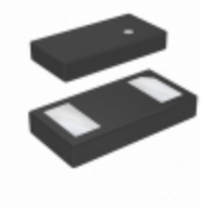
DB2L33400L1 Panasonic Electronic Components DIODE SCHOTTKY 30V 500MA 0201