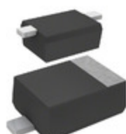
DB2J50100L Panasonic Electronic Components DIODE SCHOTTKY 50V 200MA SMINI2