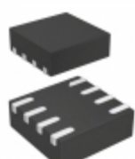
STM6503SEAADG6F STMicroelectronics IC SMART RESET DUAL PB 8 TDFN