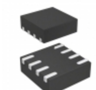
STM6503VEAADG6F STMicroelectronics IC DUAL SMART RESET 8TDFN