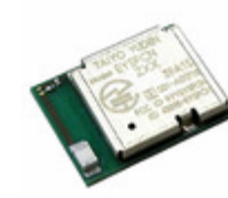
EYSFCNZXX Taiyo Yuden RF TXRX MOD BLUETOOTH CHIP ANT