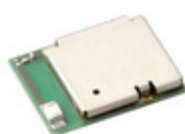
EYSGCNAWY-WX Taiyo Yuden SOFT EMBEDDED BLUETOOTH MODULE B