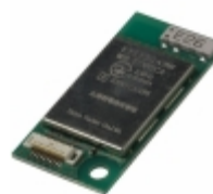
EYSFDCAXW Taiyo Yuden RF TXRX MODULE BLUETOOTH SMA ANT