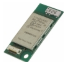
EYSFDCAWD Taiyo Yuden RF TXRX MODULE BLUETOOTH SMA ANT