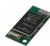
EYSFDCSWX Taiyo Yuden RF TXRX MODULE BLUETOOTH ANT