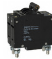
W92-X113-15 TE Connectivity Potter & Brumfield Relays CIR BRKR MAG-HYDR 15A 277VAC