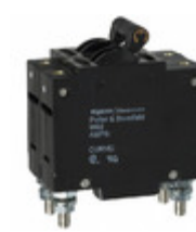
W92-X112-5 Agastat Relays / TE Connectivity CIR BRKR MAG-HYDR 5A 277VAC