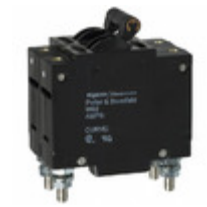
W92-X113-15 Agastat Relays / TE Connectivity CIR BRKR MAG-HYDR 15A 277VAC